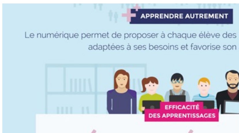
Figure 2. Infographie à caractère didactique

La didacticité transparait notamment dans des infographies qui à l'aide de mots-clefs et pourcentages viennent défendre l'idée d'un numérique source inépuisable d'avancées pédagogiques.