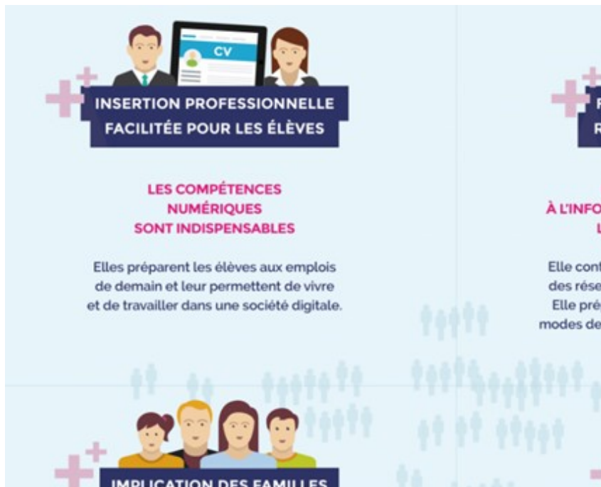
Figure 3. Infographie à caractère didactique

Une volonté de validité scientifique semble poindre, pourtant rien de ce qui est annoncé n'est justifié ou étayé de références, les pourcentages ne sont pas expliqués, tout est hors contextes.